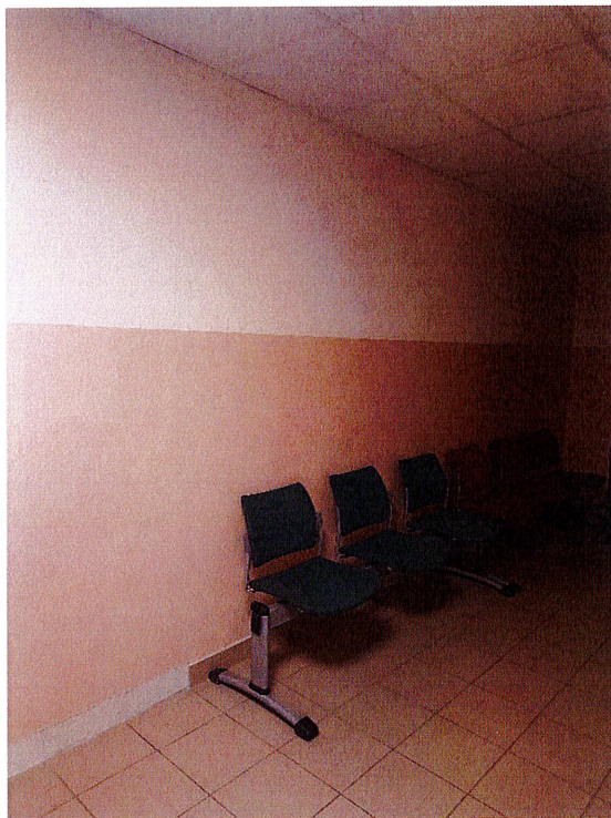
Zdjęcie 1 - Lamperia