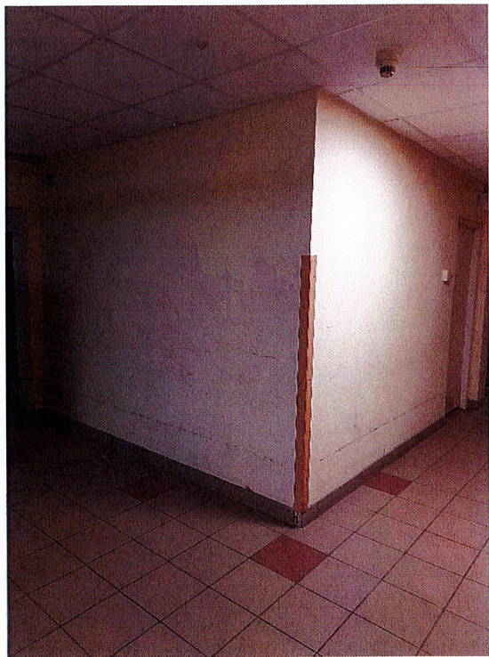
Zdjęcie 4 - Narożnik